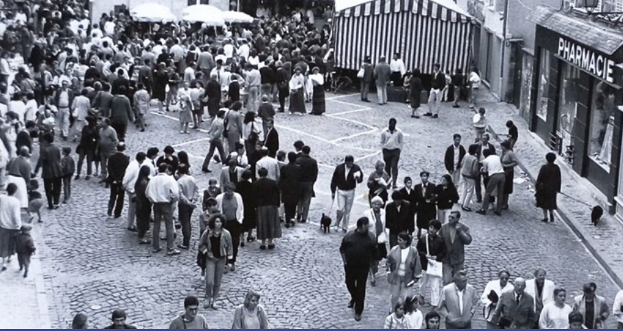
La place Henri IV lors des Rendez-Vous de Septembre